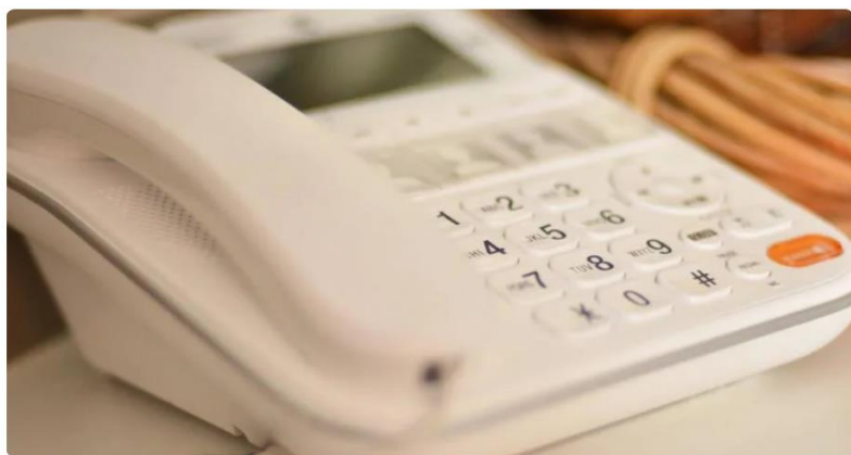
有詐騙集團假冒警察局或衛生局，以疫調名義稱民眾被匡列在接觸者名單當中，騙取個資。（示意圖）

指揮中心也提醒，不會向民眾詢問銀行帳戶、身分證字號等，更不會要求匯款、保管帳戶，民眾應特別注意，接到類似電話也可以反問對方「我的接觸者是誰」，辨識真偽。